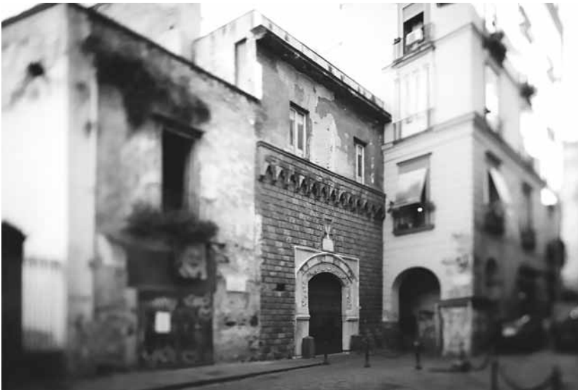
Fig. 1 - Il prospetto quattrocentesco su Piazzetta Teodoro Monticelli, foto di Sara Smarrazzo, 2018.

The fifteenth-century facade on Piazzetta Teodoro Monticelli, © Sara Smarrazzo, 2018.