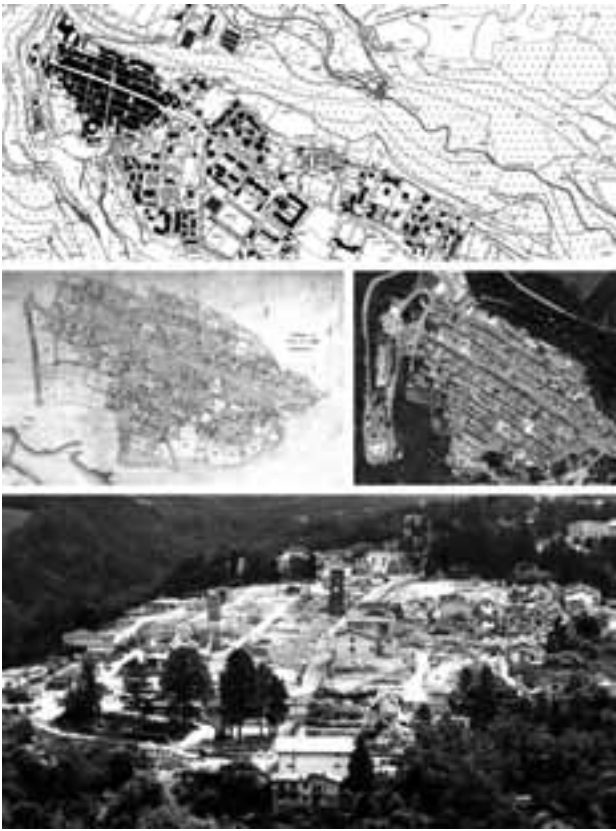
Fig. 1 - Amatrice: in alto, Carta tecnica regionale pre-terremoto 2016, con il nucleo storico, l'espansione extra-moenia del secondo '900 e il complesso di Arnaldo Foschini realizzato tra 1921 e 1960; al centro a sinistra, pianta del nucleo storico del Catasto Gregoriano, prima metà XIX sec; al centro a destra, vista zenitale del nucleo storico pre-sisma; in basso, vista del nucleo storico dopo la rimozione delle macerie, estate 2018.

Amatrice: above, 2016 pre-earthquake regional technical map, with the historic core, the extra-moenia expansion of the second half of the 1900s and the Arnaldo Foschini complex built between 1921 and 1960; center left, plan in the historic core of the Gregorian Cadastre, first half of the 19th century; center right, zenith view of the pre-earthquake historical core; below, view of the historic center after the removal of the rubble, summer 2018.