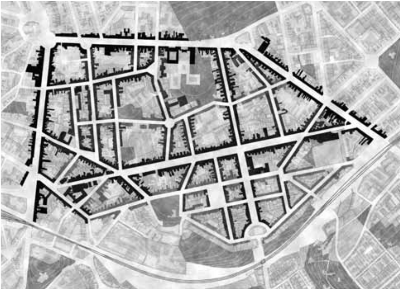
Fig. 3 - Aachen, gerarchia dei percorsi del quartiere Frankenberger Viertel (immagine tratta dalla tesi di laurea: Studio dei caratteri dell'architettura nordeuropea. Lettura comparata dell'organismo e del tessuto urbano di Aachen, Maastricht, Liegi; laureandi: Malena V., Prezioso N., Ritoli M., Russo M., Tommasi L.; coordinatore: Ieva M.).

Aachen, routes hierarchies of the Frankenberger Viertel district (picture taken from the degree thesis: Study of the characters of Northern European architecture. Comparative reading of the organism and of the urban fabric of Aachen, Maastricht; students: Malena V., Prezioso N., Ritoli M., Russo M., Tommasi L.; advisor: Ieva M.).