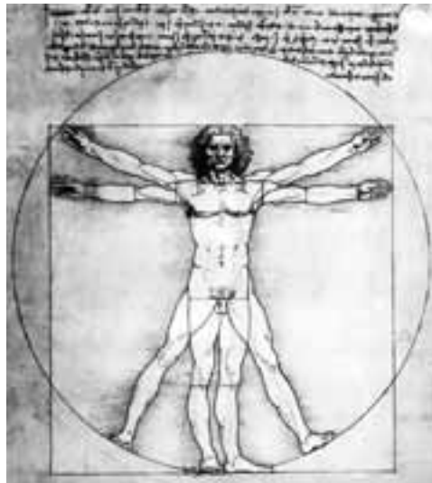
Fig. 2 - Cesare Cesariano, L'uomo vitruviano.