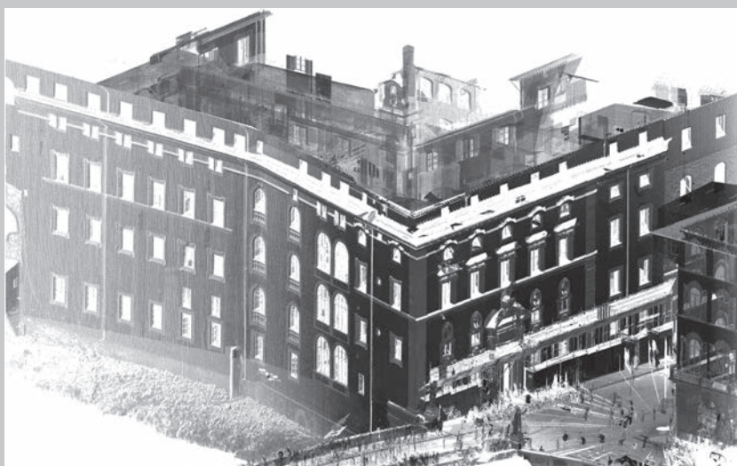
Fig. 4 - Documentazione morfometrica e cromatica del Palazzo della Missione per la ricostruzione delle vicende storico-architettoniche della fabbrica, Firenze (Alessandro Merlo, Gaia Lavoratti, Giulia Lazzari, Andrea Aliperta, Marco Corridori, Elisa Luzzi, Francesco Frullini).

Morphometric and chromatic documentation of the Palazzo della Missione for the reconstruction of historical-architectural developments, Florence (Alessandro Merlo, Gaia Lavoratti, Giulia Lazzari, Andrea Aliperta, Marco Corridori, Elisa Luzzi, Francesco Frullini).