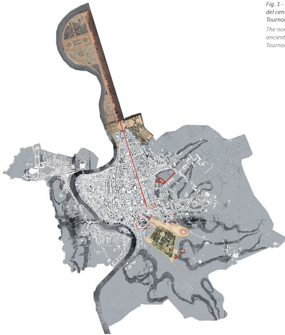
Fig. 1 - L'asse settentrionale e la risignificazione del centro antico nell' imago urbis laico con De Tournon prefetto di Roma.

The northern axis and the resignification of the ancient center in the laic imago urbis with De Tournon prefect of Rome.