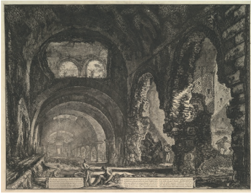
Fig. 1 - Giovanni Battista Piranesi, veduta interna della Villa di Macenate, ca. 1764. Giovanni Battista Piranesi, interior view of the Villa of Macenate, ca. 1764.