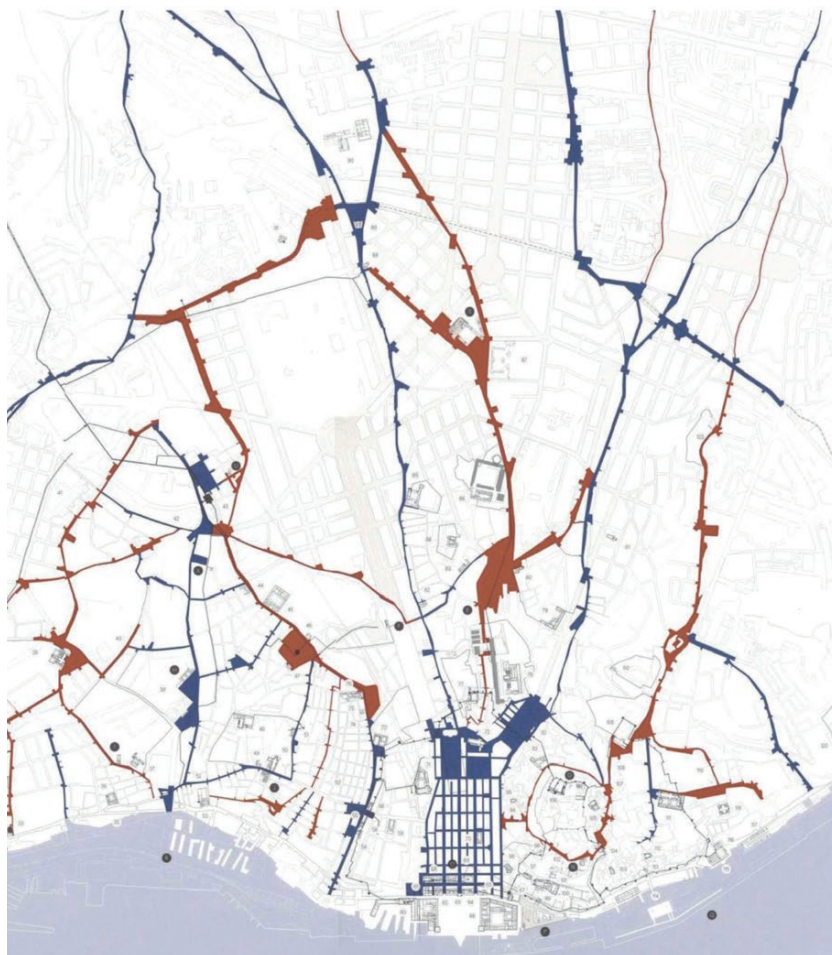
Fig. 2 - Studio su Lisbona, basato sull'evoluzione della città e sull'importanza degli antichi percorsi del festival e il suo valore per la sua definizione (credits di J. L. Carrilho da Graça, Dafne Editora, Lisbona 2015).

It was the Portuguese architect Cassiano Branco who renewed interest in the complex with a series of comparative and retrospective analyses exploring possible analogies between the Lisbon Theater and other contemporary examples in Spain (the aforementioned Sagunto and Mérida, where he noted many similarities between the two proscenium structures, although the Spanish example is larger) and North Africa (Sabratha), as well as unique exceptions compared to more traditional examples, such as the south orientation and construction along a slope, following a technique more attributable to Greek rather than Roman architecture. Between 1932