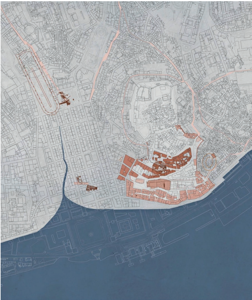
Fig. 1 - Lisbona romana: il sistema formale urbano e i monumenti (crediti di V. Tolve, A. Erbetta, A. Villani).

Roman Lisbon: the urban formal system and the monuments (credits by V. Tolve, A. Erbetta, A. Villani).